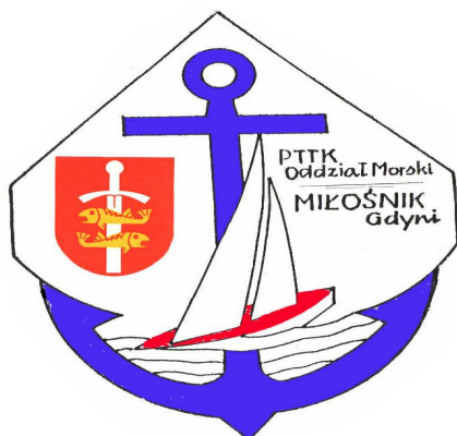
I stopień Błękitna