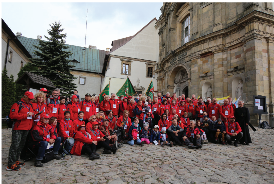
Projekt graficzny regulaminu: Wiktor Idzik - Wydawnictwo „Jedność”. Projekt tła okładki: Marek Jakóbkiewicz. Projekt odznaki rajdowej: Tomasz Rogaliński, opracowanie graficzne odznaki rajdowej: Sebastian Wróblewski.