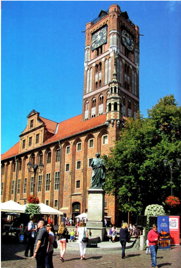
Ratusz Staromiejski w Toruniu